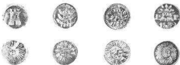
Cuartillo de Rondéau; cuartillo de 1838 y cuartillo de copones de 1839.