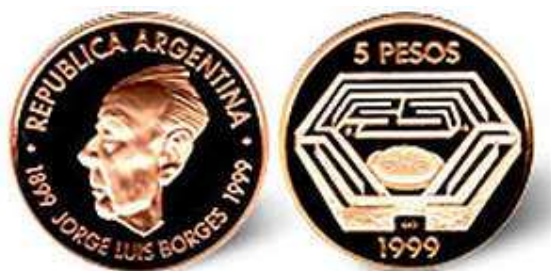
5 Pesos - Peso: 8,064 gr - Diámetro: 22 mm - Metal: Oro (Au 900/Cu 100) - Año: 1999 - Anverso: Perfil izquierdo de Jorge Luis Borges - Reverso: Un laberinto, en cuyo centro se halla un reloj de sol

El anverso de una moneda y su opuesto, el reverso o revés, se refieren a las dos caras planas de una moneda y otros objetos de dos caras, como el papel moneda, banderas, sellos, medallas, dibujos, grabados y otras obras de arte, incluso telas estampadas. El anverso es la cara frontal del objeto y cara inversa es la la cara posterior o reverso. Para nosotros, que nos gustan las monedas, el anverso de una moneda, comúnmente lo llamamos cara o cabeza (según el país), ya que a menudo presenta la cara o cabeza de una persona representativa o importante dentro de ámbito.