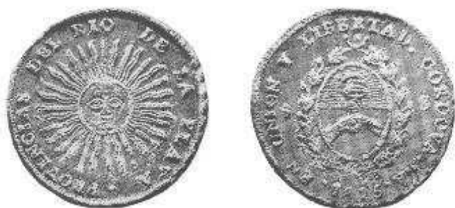
Proyecto de moneda de 8 reales acuñado en la primera Casa de Moneda de Córdoba en 1815.

Estas amonedaciones son, no obstante, las más atractivas entre todas las emisiones monetarias argentinas, por su gran variedad y porque, además, permiten apreciar el arte un poco ingenuo y primitivo de los plateros cordobeses del siglo XIX.